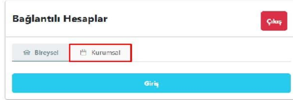
Şekil 4. Kurumsal Hesap Seçimi

5. Okul adına başvuru yapılabilmesi için öncelikle okul müdürünün Turna sisteminde kurumsal yetkili olarak tanımlanması gereklidir. Bunun için e-devlet aracılığıyla sisteme giriş sağladıktan sonra Bireysel hesabında yer alan Personel Bilgileri alanında Şekil 5'te de görülen personel bilgisi ekle butonuna tıklanır ve personel bilgisi ekleme işlemi gerçekleştirilir. Burada okul müdürü olduğuna dair bilgi girişi yapılmalıdır. Ardından tekrar Kurumsal hesap kısmına girilerek kuruma ait bilgilerin otomatik olarak yansıtıldığı görüntülenebilir.