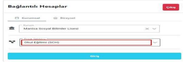
Şekil 9. Proje Sektörü Seçimi

10. Kurum seçimi ve Proje Sektörü seçimi yapıldıktan sonra Giriş butonuna tıklanır. Giriş butonuna tıkladığımızda kurumunuzun seçtiğiniz proje türüne ait ilan, başvuru ve Turna Proje bilgilerinin yer aldığı ana sayfa menüsüne yönlendirme yapılır.