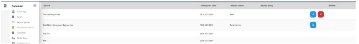
Şekil 10. Konsorsiyum Kurum Başvuru Sayfası

12. Konsorsiyum Başvuru sekmesinde “ Başvuru Yap ” butonu ile aktif ilana kurum yetkilisi başvuru gerçekleştirir. Başvuru aşamasında ilgili alanlar doldurularak başvuru işlemi tamamlanır. Tamamlanmamış başvurular için bu sayfada yer alan “ Devam Et ” butonu ile başvuru kısmında en son gelinen aşamadan mevcut başvuruya devam edilir ya da “ İptal Et ” butonu ile başvuru iptal edilir. Konsorsiyum başvuruları başvuru yapılan kurum tarafından değerlendirilir.